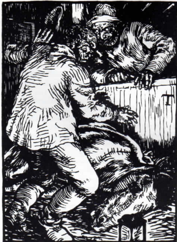
Abb. 2: Peter Trumm: Holzschnitt zu Annette von Droste-Hülshoffs »Der Rosttäuscher«, 15 x 11 cm.

Die äußere Gestalt, die der Verleger seiner Zeitschrift gab, auch deren innere Einteilung, wurde während ihres ganzen Erscheinens im wesentlichen beibehalten. Ein Heft entspricht in der Größe ungefähr der eines Buches, 22 x 15,5 cm. Der Umschlag ist weich und aus dem selben Papier, wie das übrige Heft. Aber der Tradition des Verlages entsprechend wird auch