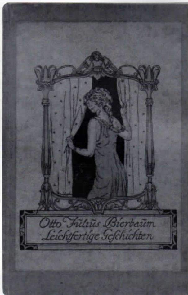
Abb. 3: Beispiel für »Die bunten Einhorn-Bücher«, 16,5 x 10,5 cm. Hier eine Einbandgestaltung von Franz Christophe.

Die eigentlichen Geschäftsräume Blumtritts befanden sich ebenfalls in der Kurfürst-Karl-Theodor-Straße, nur etwas mehr stadtwärts, in Nummer 5. Auch dieses Haus, mit dem für die Künstlerkolonie charakteristischen Fachwerk, steht nicht mehr, es ist einem Appartementhaus gewichen.