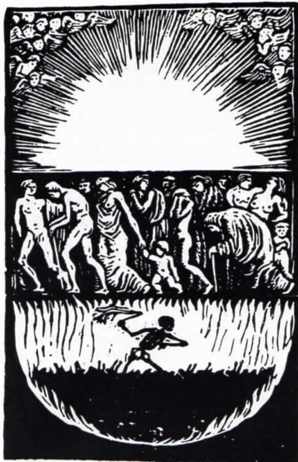
Abb. 4: Illustration von Walther Klemm zum Titelblatt von Goethes »Faust«, 14 x 9,4 cm.

unter ihnen. Die Schönheit dieser Büchlein liegt schon in ihrem Äußeren, beim Einband, dessen Vorderseite (Frontispiz) stets ein Künstlerentwurf ist, zumeist ein aufgeklebter, handkolorierter Holzschnitt. Ein Datum der Herausgabe kommt nur ein einziges Mal vor: 1916.