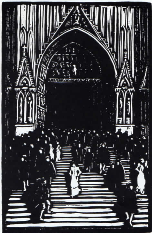
Abb. 5: Goethe »Faust«, Illustration von Walther Klemm, 14 x 9,2 cm.

Für die Ermittlung der Verlagsproduktion gibt es zwei Quellen. Einmal stets die letzten Seiten eines beliebigen Einhorn-Buches, weil diese zu Verlagsanzeigen ausgenutzt waren. Die zweite Quelle: etwaige Anzeigen in der Monatszeitschrift »Der Bücherwurm«, auf die wir später zu sprechen kommen. Bei aller Bemühung, diese beiden Quellen aufeinander abzustimmen und sie zu benutzen, erfährt man bald, daß sich auf diesem Wege, namentlich durch das Fehlen der Herausgabebezahlungen, etwas eindeutig Genaues, wissenschaftlichen Ansprüchen Entsprechendes nicht erzielen läßt. Plötzlich stellt sich auch noch eine neue Schwierigkeit ein: unter die die Literatur betreffenden Buchtitel mischen sich solche, die geschichtliche Werke meinen, wie z. B.